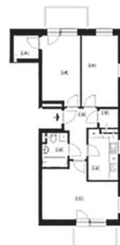
SPÓŁDZIELNIA MIESZKANIOWA W DZIERŻONOWIE MIESZKANIE B1 62,57 m 2