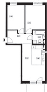
SPÓŁDZIELNIA MIESZKANIOWA W DZIERŻONOWIE MIESZKANIE A1 56,10 m 2